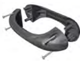
HANDGREEP VAN ABS-KUNSTSTOF