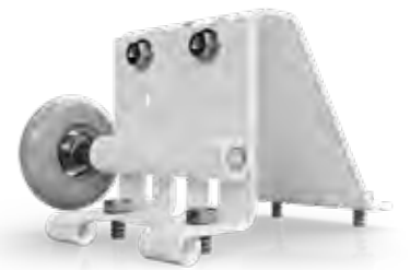
GELUIDLOZE WITTE ROLLEN