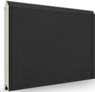
zand antraciet grijs AP 60