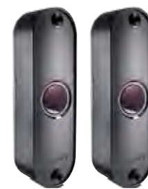
MASTER PRO BITECH