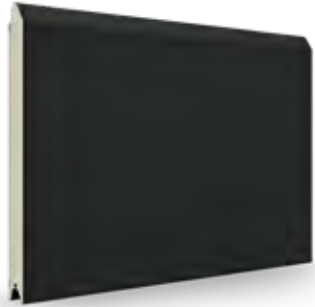
antraciet AP 40