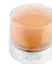
WAARSCHUWINGSLAMP MET RTS-ANTENNE