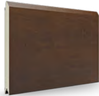
Winchester AP 95