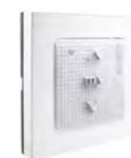
SMOOVE IO ZENDER