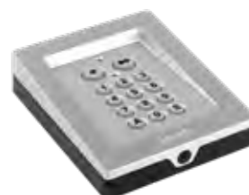
METALEN DRAADLOOS RADIOTOETSENBOARD io