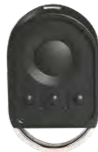
SOMFY KEYGO 4 RTS