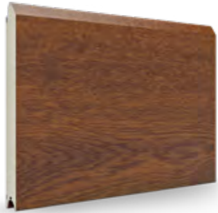
gouden eik AP 23