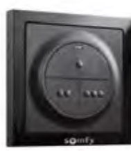
DRAADLOOS CODETOETSENBOARD RTS