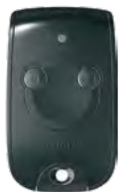
SOMFY KEYTIS 2 RTS