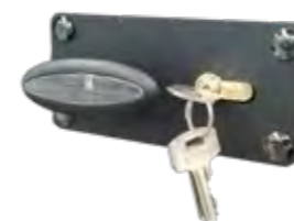
HANDGREEP + SLOT