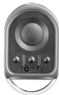
SOMFY KEYGO 4 io