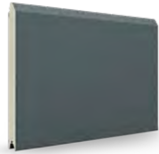
zandgrijs AP 61