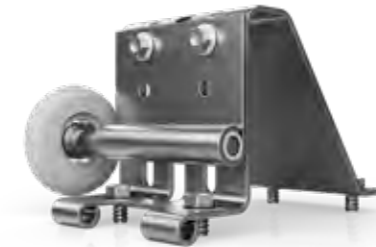
GELUIDLOZE GEGALVANISEERDE ROLLEN