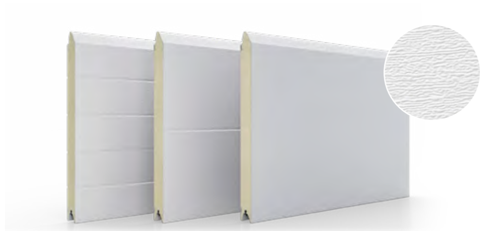
Woodgrain glad paneel, met lage en hoge ribben