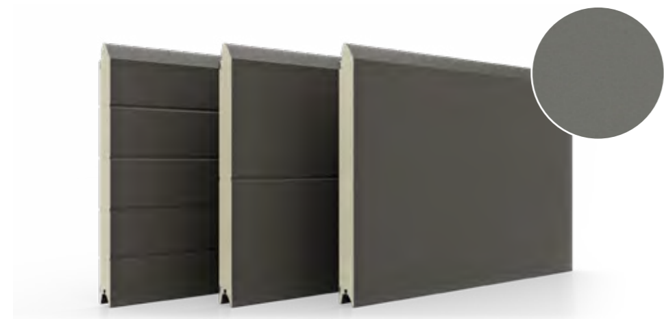
glad paneel, met lage en hoge ribben

Het meest zichtbare onderdeel in elke garagedeur is het deurblad, dat bestaat uit panelen. Dankzij moderne technologieën hebben we hier veel mogelijkheden tot personalisatie. Deze omvatten: