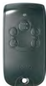
SOMFY KEYTIS 4