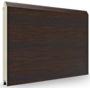
donkere eik AP 06